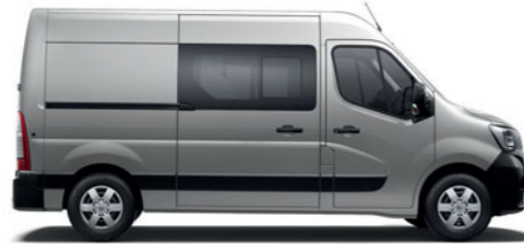
Kastenwagen mit Doppelkabine