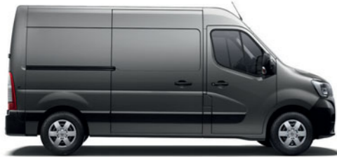
Kastenwagen mit Frontantrieb

Mit einem Nutzvolumen von 8 bis 20 m 3 , zahlreichen Innenausstattungsvarianten und verschiedenen Länge-Höhe-Kombinationen werden Ihre vielfältigen Bedürfnisse erfüllt.